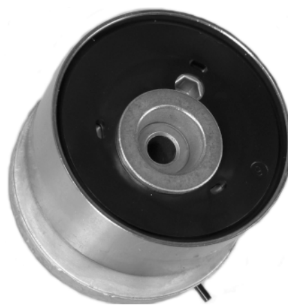
Fig. 2 Nova versão

Quando a chave sextavada é retirada, a tensão fica automaticamente ajustada.